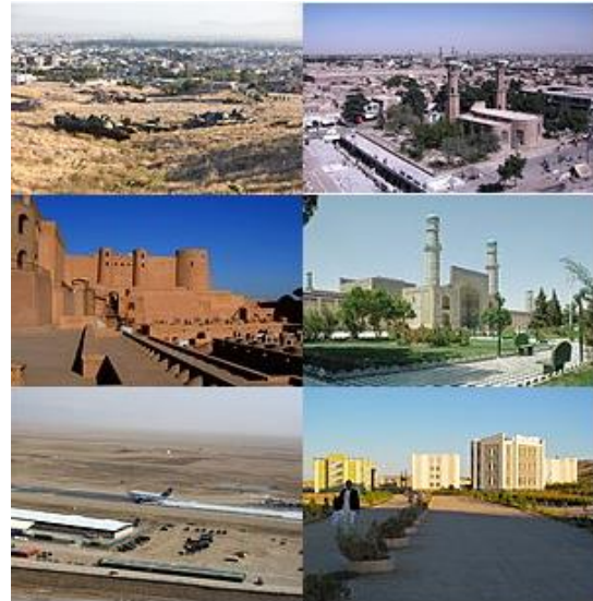
Nickname(s): The Pearl of Khorasan

Nimen t-kirjainta epäileville mainittakoon, että Heratia persialaiset kutsuivat nimillä ”Haraiva” ja ”Hare”, ja meedialaiset puolestaan nimellä ”Hara”, aivan niinkuin paikallinen väestö tänä päivänä (Britam, Afghanistan and Israel, 2011).