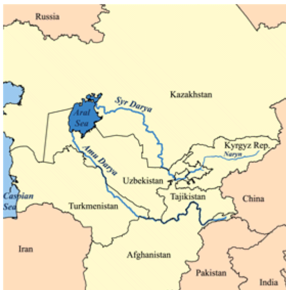
Kuva 3: Amu Darya. Eli Gozan, saa alkunsa Aralinmerestä

Tätä jokea et varmasti löydä helpolla, koska sen nimi on vaihtunut täysin toisenlaiseksi. Joen nykyinen nimi on nimittäin Amu Darya. Nimenvaihto on onneksi dokumentoitu (Wikipedia, Amu Darya, 2011).