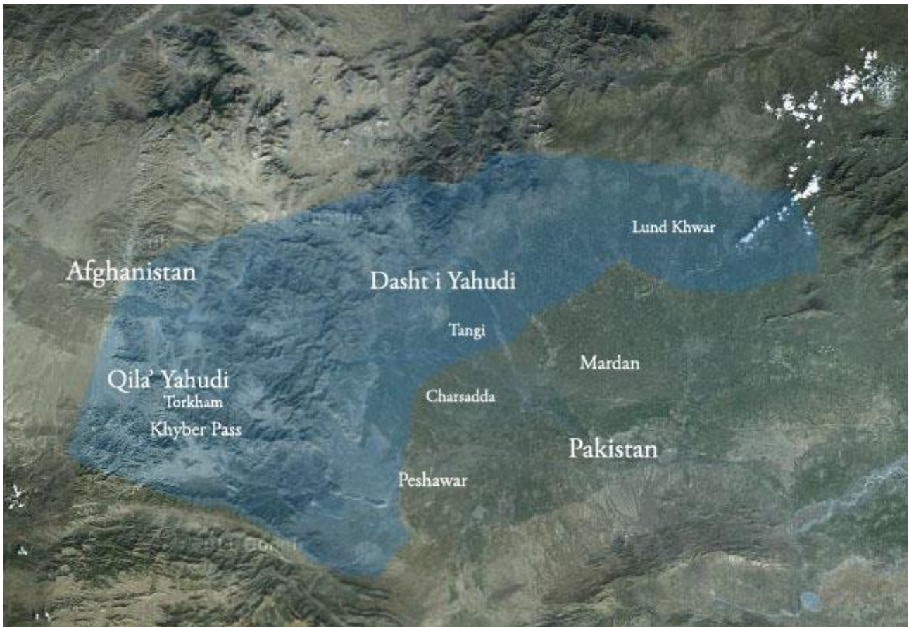
Kuva 4: Dasht i Yahudi, juutalaisten aro. Ja Qila' Yahudi, juutalaisten linnoitus. Huomaa myös Peshawar

Viimeisenä naulana arkkuun tässä asiassa voidaan jo pitää sitä seikkaa, että Afghanistanissa ja Pakistanissa sijaitsevat tänäkin päivänä paikat, Qila' Yahudi (juutalaisten linnoitus) ja Dasht i Yahudi (juutalaisten aro) (Wikipedia, Dasht e Yahudi, 2011). Ja juuri niissä paikoissa jonne Israel vietiin. Siellä on myös Khyber sola, ja khyberhän on hepreaksi: linna (Afghanistan ohje, s.131, 2011).