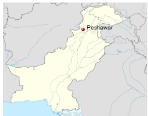
Kuva 1: Peshawar, pohjoisessa Pakistanissa

Heprean kieltä taitavat ymmärtävät, että Hawar on sama kuin Habar, Habor, koska hepreean kielessä b:tä ja v:tä