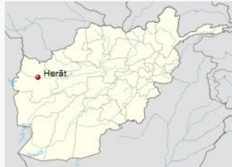
Kuva 2: Herat. Kukoistava kaupunki